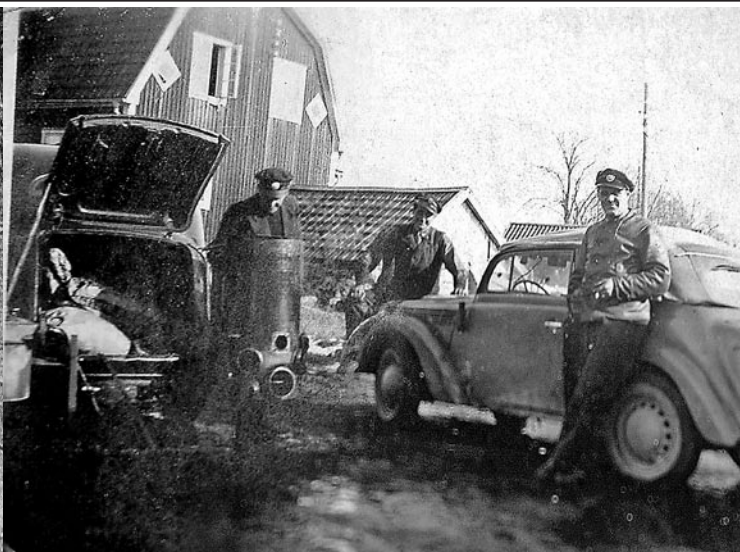
Både Gullans far och make körde taxi. Under andra världskriget blev det extra komplicerat med gengastekniken som ersatte bensinen. Gullans blivande man Harry till höger.